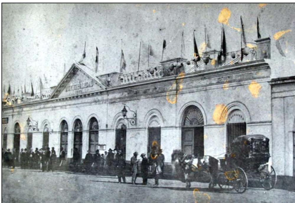
Fachada primitiva Municipalidad de Chivilcoy.